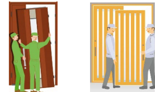
既存ドアを取り除き、新たなドア・引戸に交換